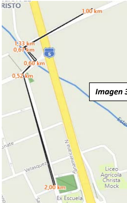
Imagen 3. Ruta 2K

c) 2 Kilómetros: Largada en la Plaza de Nogales, continuando por calle Felix Vicuña y luego por el puente a La Peña siguiendo la Ruta F-301 hasta punto de entrega de testimonio volviendo por Puentes La Peña, incorporándose nuevamente a Nogales por calle Felix Vicuña hasta la meta en la Plaza.