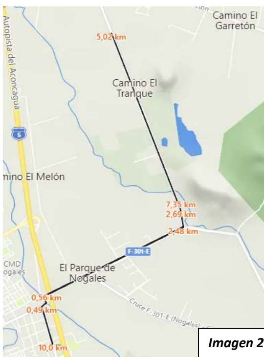
Imagen 2. Ruta 10K