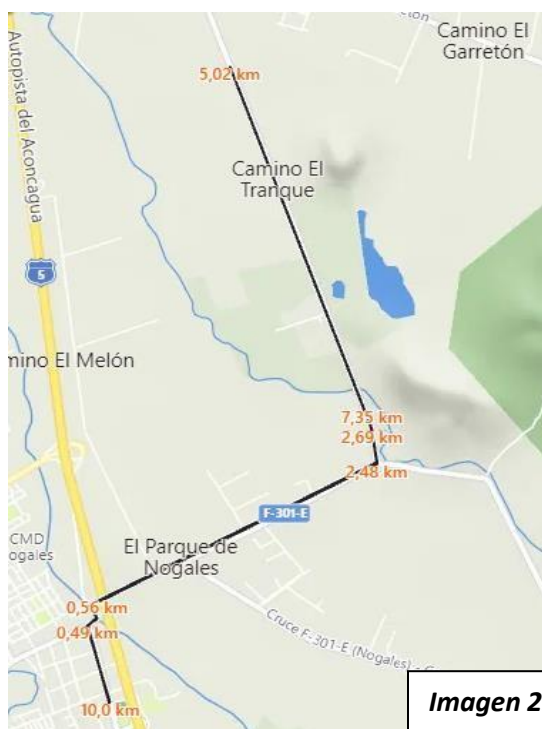
Imagen 2. Ruta 10K

b) 10 Kilómetros: Largada en la Plaza de Nogales, continuando por calle Felix Vicuña y luego por el puente a La Peña (Ruta F-301), desviando por Camino El Tranque (Ruta F-341) hasta el punto de hidratación donde se entregará testimonio para volver por la misma ruta a Camino a La Peña (Ruta F-301) incorporándose a Nogales por calle Felix Vicuña hasta la meta en la Plaza.