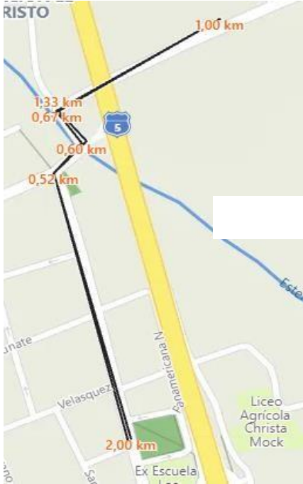
Imagen 3. Ruta 3K

c) 3 Kilómetros: Largada en la Plaza de Nogales, continuando por calle Felix Vicuña y luego por el puente a La Peña siguiendo la Ruta F-301 hasta punto de entrega de testimonio volviendo por Puente La Peña, incorporándose nuevamente a Nogales por calle Felix Vicuña hasta la meta en la Plaza.