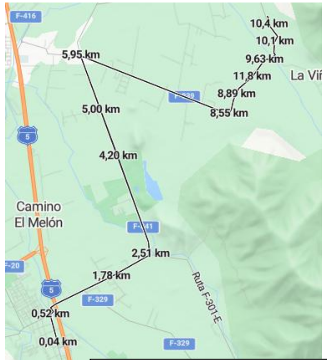
Imagen 1. Ruta Media Maratón

a) Media Maratón: Largada en la Plaza de Nogales, continuando por calle Félix Vicuña y luego por el puente a La Peña (Ruta F-301), desviando por Camino El Tranque (Ruta F-341) hasta la Hacienda de El Melón. En la intersección con la ruta F-339 subir por el camino al Garretón hasta el final del camino (portón) girando a la izquierda por el camino al estero hasta cruzar el estero El Garretón y continuar por el camino de La Ladera y “girando en U” en el kilómetro 10.55 para volver por la misma ruta. Así debe nuevamente cruzar el Estero El Garretón y volver bajando por la ruta F-339, F-341 y F-301 hasta el paso sobre nivel de la ruta 5 Norte, cruzar el puente volviendo por la calle Pedro Félix Vicuña llegando a la meta en la plaza de Nogales.