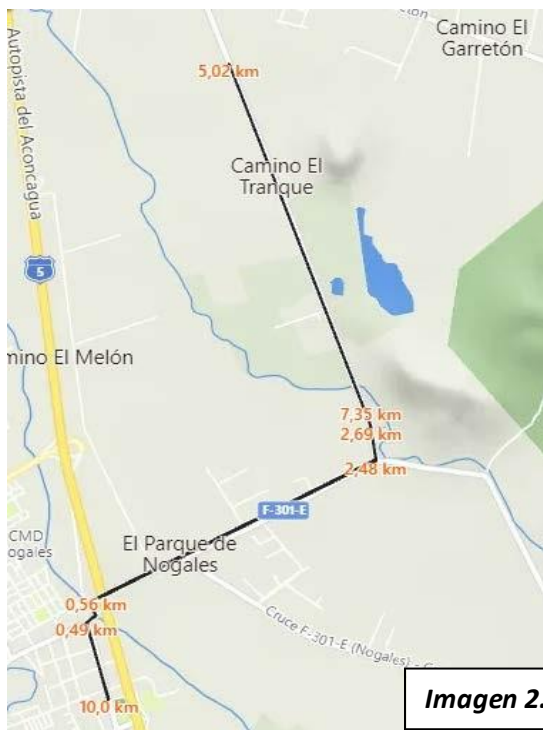
Imagen 2. Ruta 10K

b) 10 kilómetros: Largada en la Plaza de Nogales, continuando por calle Félix Vicuña y luego por el puente a La Peña (Ruta F-301), desviando por Camino El Tranque (Ruta F-341) hasta el punto de hidratación donde se entregará testimonio para volver por la misma ruta a Camino a La Peña (Ruta F-301) incorporándose a Nogales por calle Félix Vicuña hasta la meta en la Plaza.