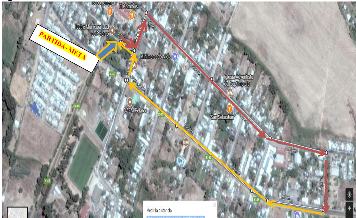
Figura n°1: Plano del recorrido 2k:

9.1. Trayecto 2 km. Partida: en Avenida Catedral en la plaza de armas de Pelarco frente a la Municipalidad, giro a la izquierda por calle Domingo Leal hasta intersección con Avenida Cintura luego giro a la derecha por calle Cintura hasta calle Letelier giro a la derecha en dirección a la Avenida San Pedro hasta Domingo Leal y finaliza en Catedral 50 frente a la Municipalidad lugar de partida.