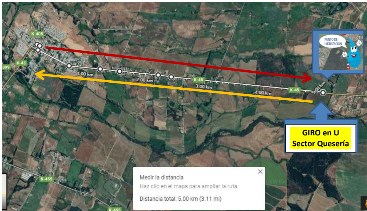
Figura N°3. Plano del recorrido 10 k:

9.3.- Trayecto 10 Km. Partida: en Avenida Catedral 50 en la plaza de armas de Pelarco frente a la Municipalidad, giro a la derecha por calle Domingo Leal hasta intersección con Avenida San Pedro luego giro a la izquierda por avenida San Pedro hasta el kilómetro 21 aproximadamente de la Ruta K-45 en dirección al sector San Quesería hasta el lugar demarcado giro en U por la misma ruta hasta llegar al frente de la Municipalidad lugar de partida.