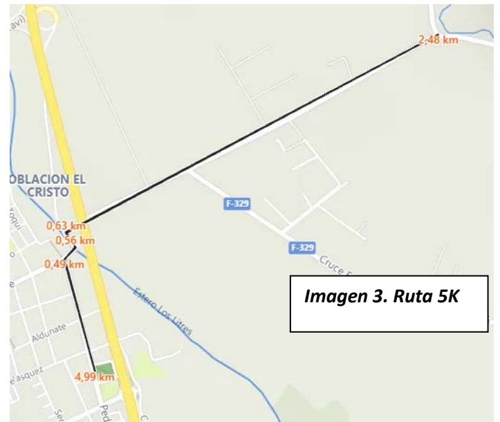
Imagen 3. Ruta 5K

d) 2 Kilómetros: Largada en la Plaza de Nogales, continuando por calle Felix Vicuña y luego por el puente a La Peña siguiendo la Ruta F-301 hasta punto de entrega de testimonio volviendo por Puente La Peña, incorporándose nuevamente a Nogales por calle Felix Vicuña hasta la meta en la Plaza.