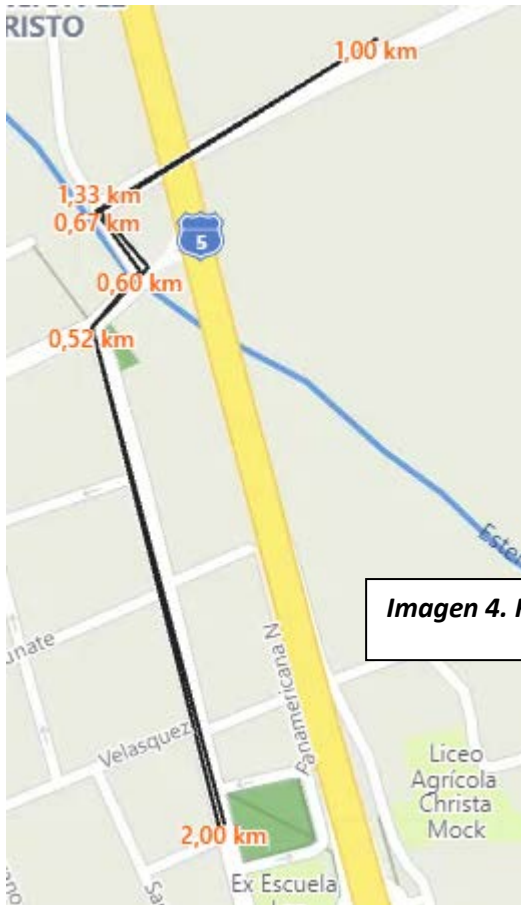
Imagen 4. Ruta 2K

c) 5 Kilómetros: Largada en la Plaza de Nogales, continuando por calle Felix Vicuña y luego por el puente a La Peña siguiendo la Ruta F-301 llegando al desvío al Camino El Tranque (Ruta F-341) donde se entregará testimonio para volver por la misma ruta hasta el Puente de La Peña, incorporándose nuevamente a Nogales por calle Felix Vicuña hasta la meta en la Plaza.